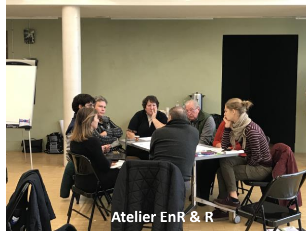
Atelier EnR & R

Il n'y a pas eu de CR de ces ateliers, mais les cartes mentales annotées et complétées, qui ont été retranscrites dans le projet de plan d'actions, soumis ensuite à la validation des COTEC et COPIL.