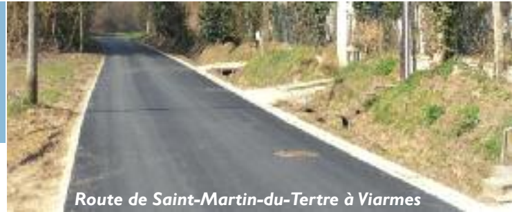
Route de Saint-Martin-du-Tertre à Viarmes

Depuis 2007, nous avons procédé à des travaux de réfection annuels et après une pause en 2011, rendue nécessaire par la coordination préalable de travaux d'assainissement, au printemps 2012 s'achève la réfection de la dernière tranche de travaux sur la route de Saint-Martin-du-Tertre à Viarmes pour un coût de travaux de 98.870 euros Hors Taxes.