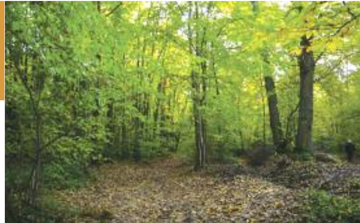
Forêt de Carnelle